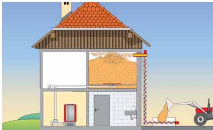
Befüllsystem von aussen für Lagerraum im 1.Stock