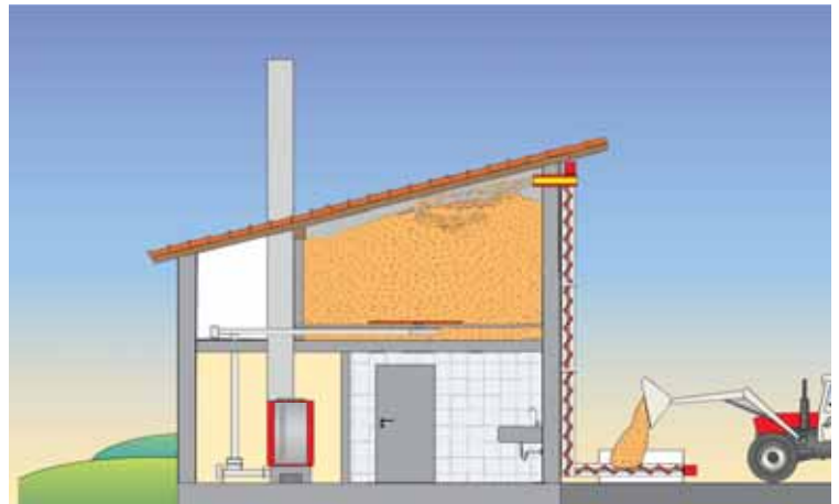
Befüllsystem von aussen für Lagerraum im 1. Stock