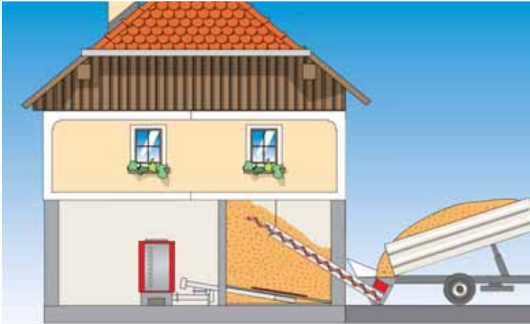
Für einstöckige Lagerräume mit Schrägschnecke