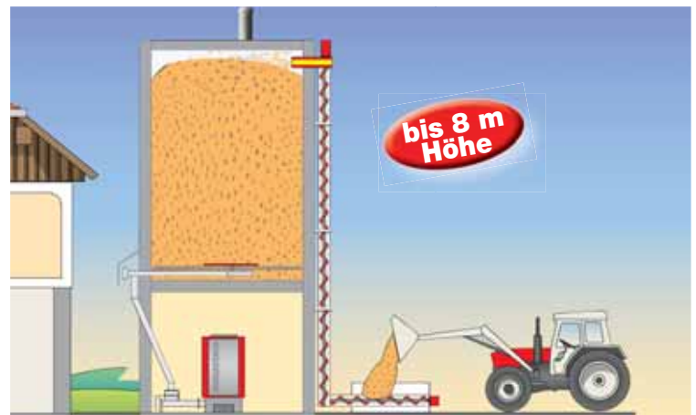
Befüllsystem von aussen für Lagerraum im Rundsilos