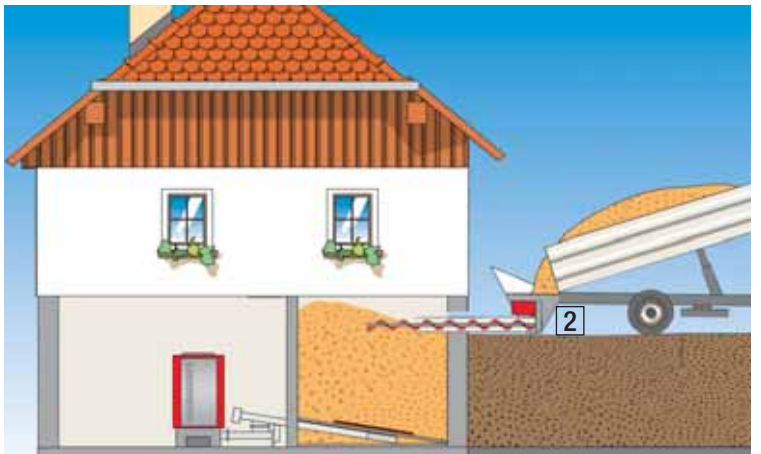
Für Kellerräume mit Trog und waagrechter Befüllschnecke