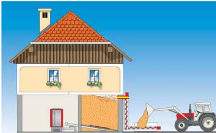
Befüllsystem von aussen für 1-stöckigen Lagerraum