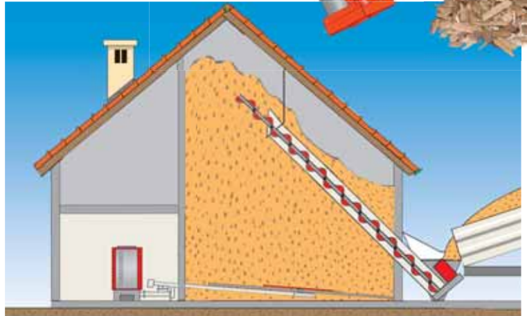
Für doppelstöckige Lagerräume mit Schrägschnecke

Waagrechte Schnecke: 1 Anschluss der Einschubschnecke direkt an den Trog oder 2 mittels Winkelantrieb an den Trog